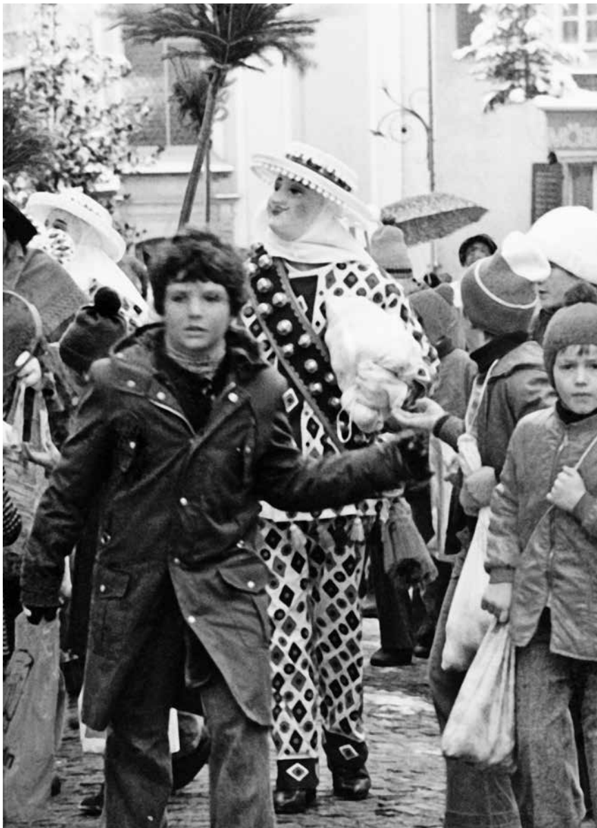
Verkleiden, Tanzen, Schenken, Unterhalten, das gehört zur Fasnacht. Blätz im Hauptort Schwyz.