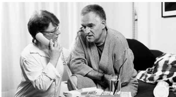
Das Pallifon hilft Palliativpatienten in Notfällen.