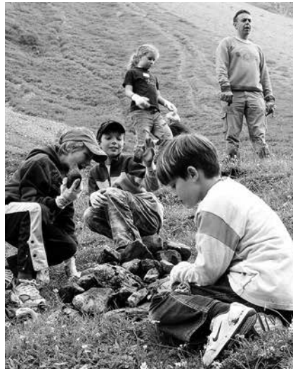
Kinder und Familien stehen im Synodenmittelpunkt.

Diesmal ist der Grundton konsequent seelsorgerisch gehalten. Auf wertende kirchenrechtliche Begriffe wie «irreguläre Situationen» etwa zur