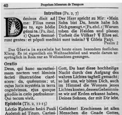
Die Messe mitlesen: Lateinisch-deutsches Volksmessbuch von 1963.

Gemeinschaft, die bereit ist, auf die Zeichen der Zeit zu achten und im Glauben zu wachsen. Sie bildet die Grundlage für den Dialog zwischen Gott und den Menschen, wie er in der Liturgie stattfindet. – Weiterlesen: Dialekt im Gottesdienst: www.liturgie.ch (Rubrik: handeln – mit allen Sinnen)